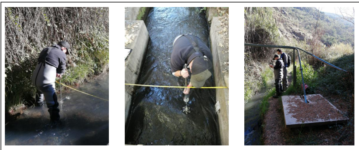
Imagen 5. DGA realizando mediciones de aforo

Durante el año 2021, la Municipalidad de Lo Barnechea ha denunciado a la Dirección General de Aguas sobre posibles extracciones irregulares, tanto desde viviendas colindantes al estero como de la Asociación de Canalistas del Canal La Poza, la cual se presenta en el Anexo 2. Esta denuncia fue acogida por la DGA, verificándose que desde el Canal La Poza se extrajo más agua que la autorizada, aplicándose una multa a beneficio fiscal.