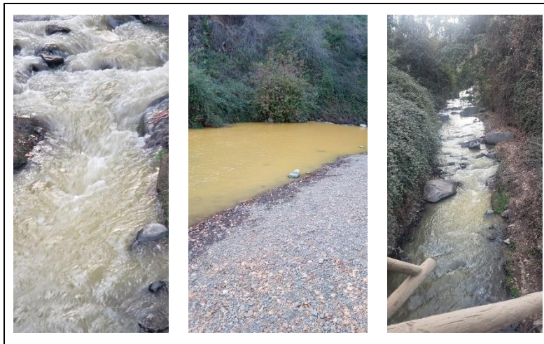
Imagen 10. Evidencia de denuncia realizada por el Santuario de la Naturaleza Los Nogales por cambio de coloración del cauce