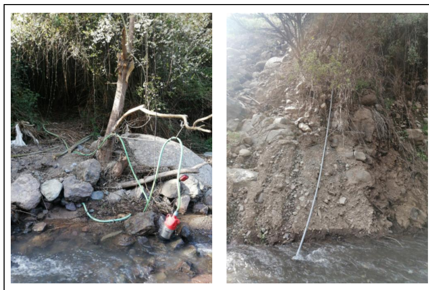
Imagen 3. Captaciones Irregulares de Agua del Estero del Arrayán