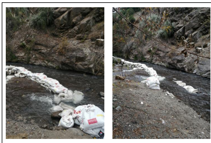
Imagen 4. Desvío irregular de agua

Las extracciones del Estero del Arrayán se encuentran normadas por la Dirección General de Aguas, estableciendo que, desde el Estero, en total, se pueden extraer por mes los siguientes litros: