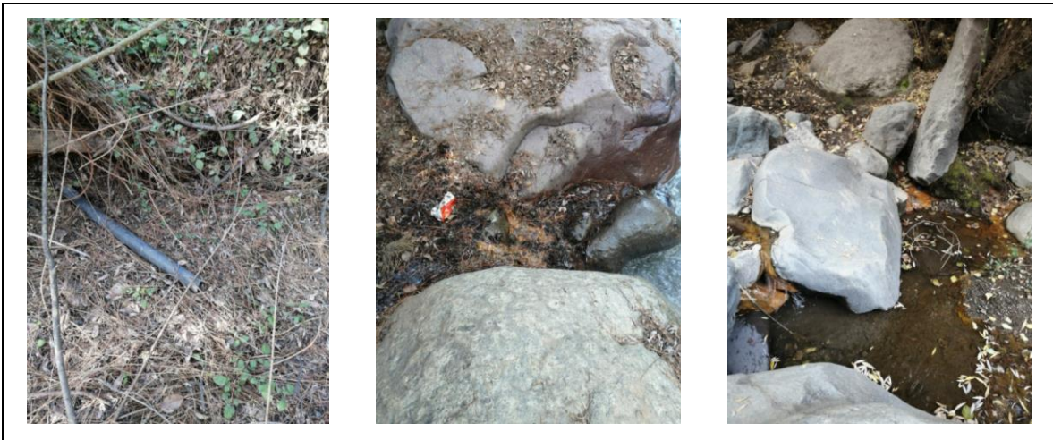
Imagen 7. Descargas irregulares de aguas servidas

Estos antecedentes han sido remitidos mediante una denuncia a la SEREMI de Salud, entidad que concurrió en septiembre del año 2021 a fiscalizar esta situación, sin embargo, a la fecha no ha dado respuestas sobre el resultado de la denuncia. La denuncia, el acta de fiscalización y la solicitud de información frente al estado de la denuncia, se adjuntan en el Anexo 3.