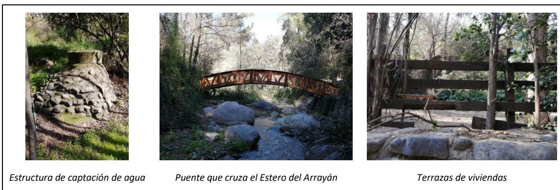
Estructura de captación de agua