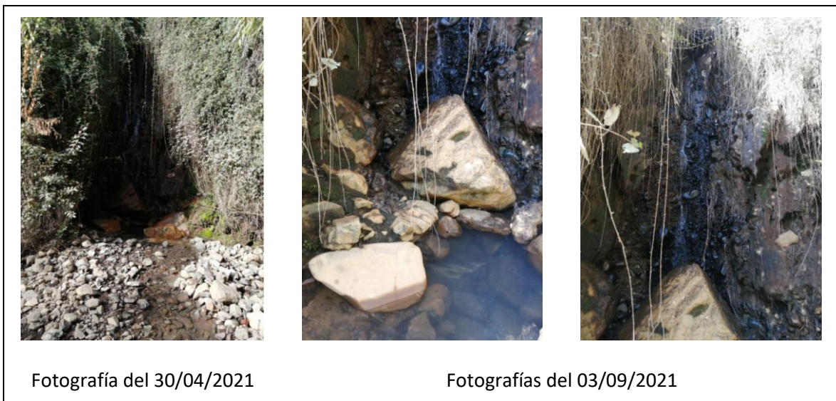
Imagen 8. Punto de Descarga cercano a la Planta de Aguas Cordillera

Por último, en el Estero es posible identificar un sector de descarga proveniente ubicado muy cercano a la Planta de Potabilización de Aguas Cordillera, donde a diario durante la mañana, se realiza una descarga hacia el cauce, como se muestra en la siguiente imagen. Las piedras de color amarillo, se presumen tienen ese color por el efecto del cloro, luego del tratamiento de potabilización.