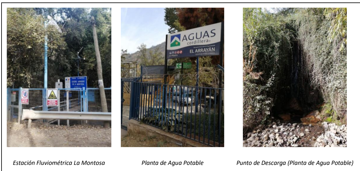
Imagen 2. Infraestructura presente en el Estero del Arrayán

El Uso Industrial y Productivo se refiere a las actividades económicas que se desarrollan en torno al sistema hídrico del Estero del Arrayán, entre ellas destacan la minería, debido a la presencia de Anglo American en la zona, eventualmente la generación de energía solar, con el Proyecto Parque Solar Cordillera y la agricultura, que se realiza con extracción de agua para este fin. En el sector alto de esta cuenca se desarrolla tradicionalmente la actividad ganadera.