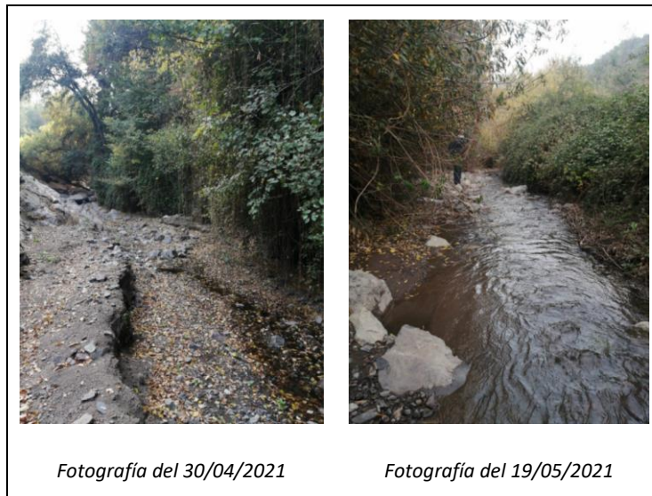
Imagen 6. Comparativo del Estero Arrayán entre abril y mayo 2021